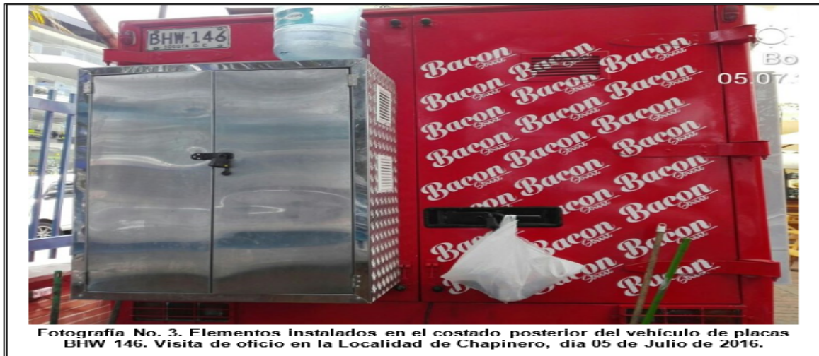
Fotografía No. 3. Elementos instalados en el costado posterior del vehículo de placas BHW 146. Visita de oficio en la Localidad de Chapinero, día 05 de Julio de 2016.

ALCALDÍA MAYOR DE BOGOTÁ D.C. SECRETARÍA DE AMBIENTE