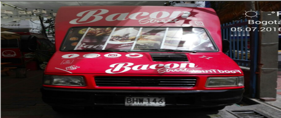
Fotografía No. 2. Elementos instalados en el costado anterior del vehículo de placas BHW 146. Visita de oficio en la Localidad de Chapinero, día 05 de Julio de 2016.